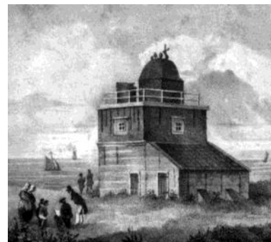
Gedeelte van een litho van de gebroeders Van Lier, uit circa 1840.