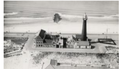
Vuurtoren, lichtwachterswoningen en proefstation in 1934.