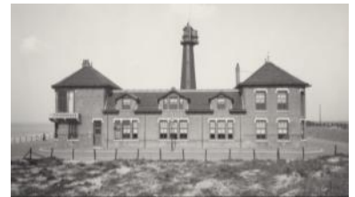
Het proefstation in 1918.

Als de scheuren in de toren zijn hersteld zijn er geen bedreigingen meer.