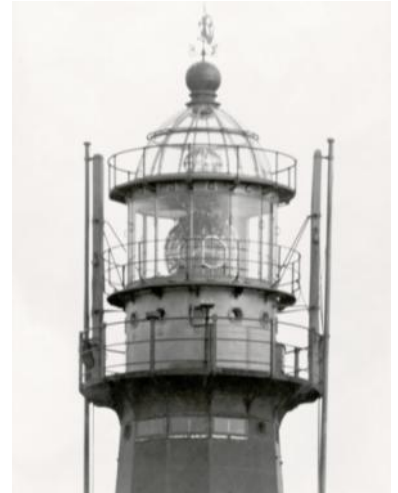
In 1922 kreeg de vuurtoren een nieuwe scheepvaartoptiek, een luchtvaartoptiek en een glazen koepel met een extra omloop.