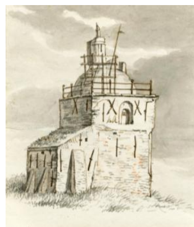
De vuurbaak op een tekening van Nolthenius de Man uit 1815.

Op 15 december 1874 werd de bouw van deze toren aanbesteed aan de firma Nering Bögel uit Deventer. De twaalfzijdige toren werd opgebouwd uit rechthoekige gietijzeren