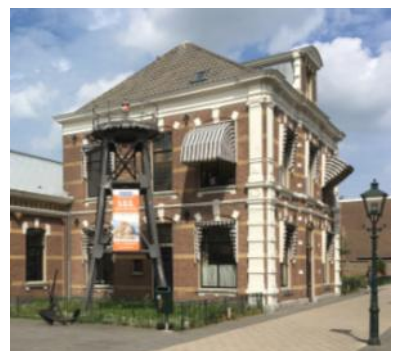
Replica van het zuidelijke havenlicht uit 1904, naast de ingang van Muzee Scheveningen.