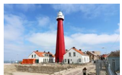
Vuurtoren en lichtwachterswoningen in april 2021. Het gebouw van het Loodswezen ernaast is geheel gesloopt. De bouw van het appartementencomplex moet nog beginnen.