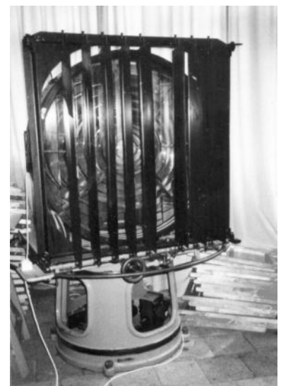
De optiek van 1909 met jaloeziënscherm.