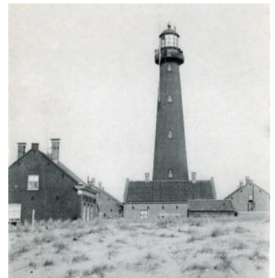
De vuurtoren en lichtwachterswoningen in 1906. Links de extra woning uit de jaren tachtig van de negentiende eeuw.