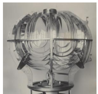
De luchtvaartoptiek van 1922.