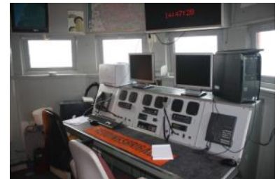
Het uitkijklokaal van de reddingsbrigade op de zesde verdieping van de vuurtoren.