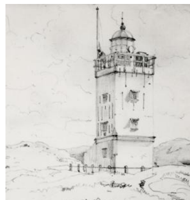
De verhoogde vuurbaak op een tekening van W.A. van Deventer uit 1854.