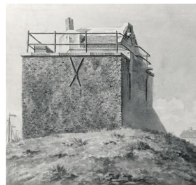
De vuurbaak op een tekening van Jean François Valois uit 1800.