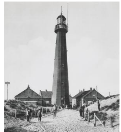
De vuurtoren en lichtwachterswoningen in 1897.