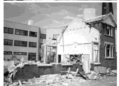
Afbraak van het proefstation en nieuwbouw voor het Loodswezen in 1977.