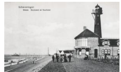
Scheveningen in 1909, met het pas gereed gekomen proefstation.