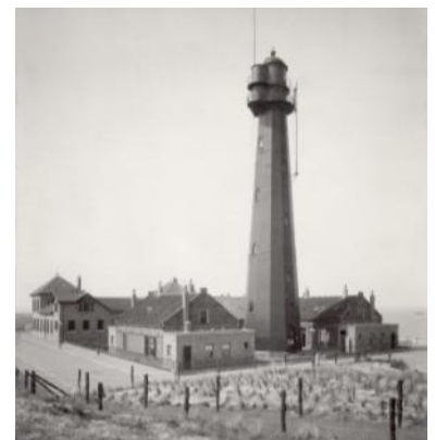
De vuurtoren en lichtwachterswoningen omstreeks 1918. Achter de woningen bevindt zich het proefstation.