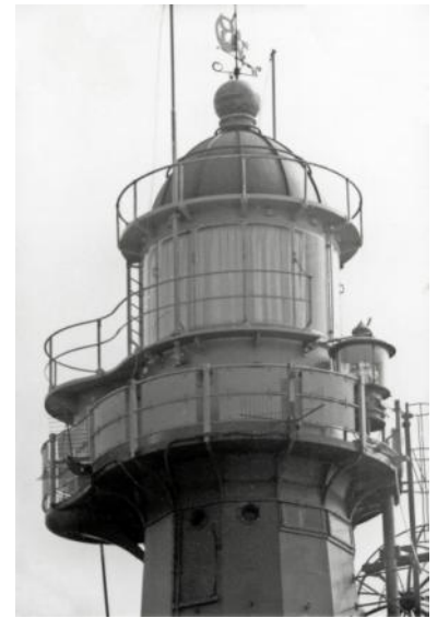
De kop van de vuurtoren in 1960. Op de omloop is een hulplicht geplaatst.

In 1904 werd in Scheveningen de nieuwe haven geopend. Op beide havendammen werd in dat jaar een ijzeren, opengewerkt havenlicht geplaatst. Toen in de jaren negentienzestig de havenmond verzandde werd besloten de havendammen te verlengen. In 1970 is de noordelijke havendam met 500 meter verlengd en de zuidelijke met 650 meter. De ijzeren havenlichten zijn daarbij verwijderd. Er kwamen nieuwe betonnen havenlichten op de uiteinden van de dammen. De ijzeren havenlichten zijn naar het