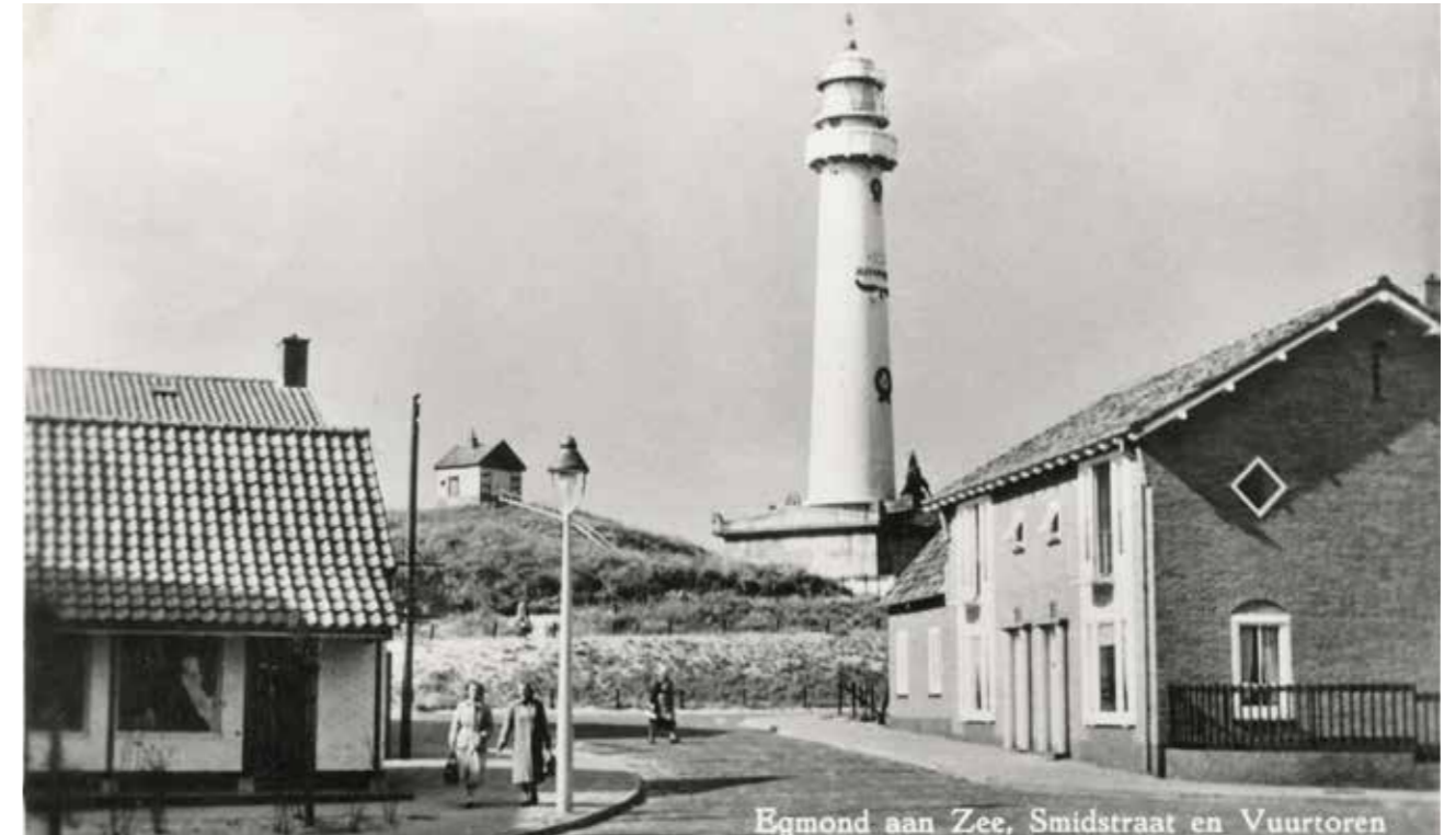
Egmond aan Zee in de jaren 1950. Op het duin links van de vuurtoren staat de kustwachtpost, die in 1949 werd verbouwd.