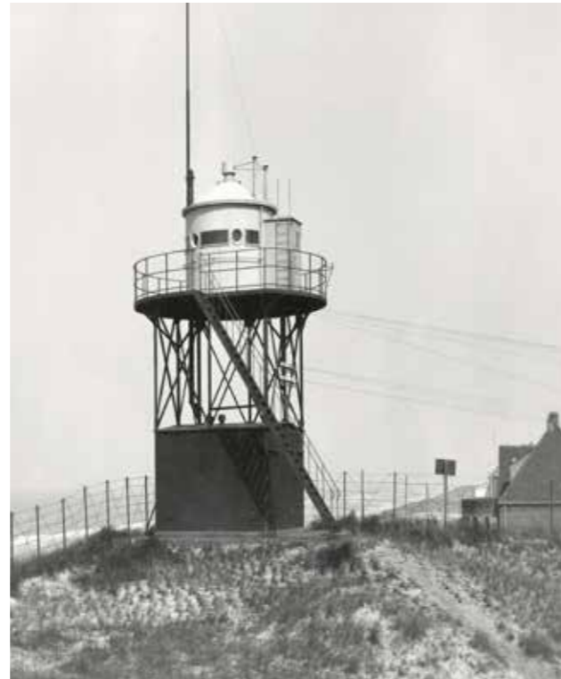
De in 1916 gebouwde ijzeren kustwachtpost, op een foto van vóór 1949.