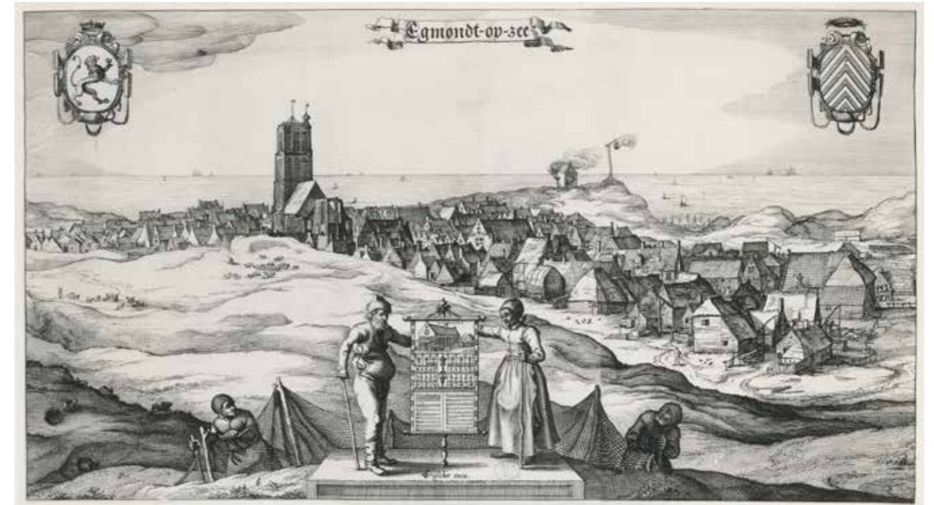
Egmond aan Zee in 1615 op een tekening van C.J. Visser, met de Sint Agneskerk en aan de kust twee vuurboeten op een hoog duin.

In die tijd werd de Noordzeekust regelmatig geteisterd door stormen. Het duingebied bij Egmond kalfde steeds verder af waardoor het dorp in gevaar kwam. Tijdens de kerststorm van 1717 verdween een deel van het dorp in de golven en was de kustlijn zo ver naar binnen gekomen dat de toren van de Agneskerk op omvallen stond. Er werd daarom een verdedigingswerk van rijshout aangelegd maar het mocht niet baten. Op 27 november 1741 stortte de westzijde van de kerktoeren onder stormgeweld in. Omdat de toren zo belangrijk was voor de scheepvaart