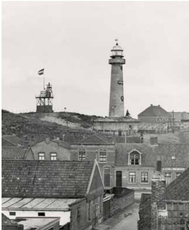
De vuurtoren in 1923 aan het eind van de verbouwing, met luchtvaartkoepel. Op de kustwachtpost staat een hulplicht.