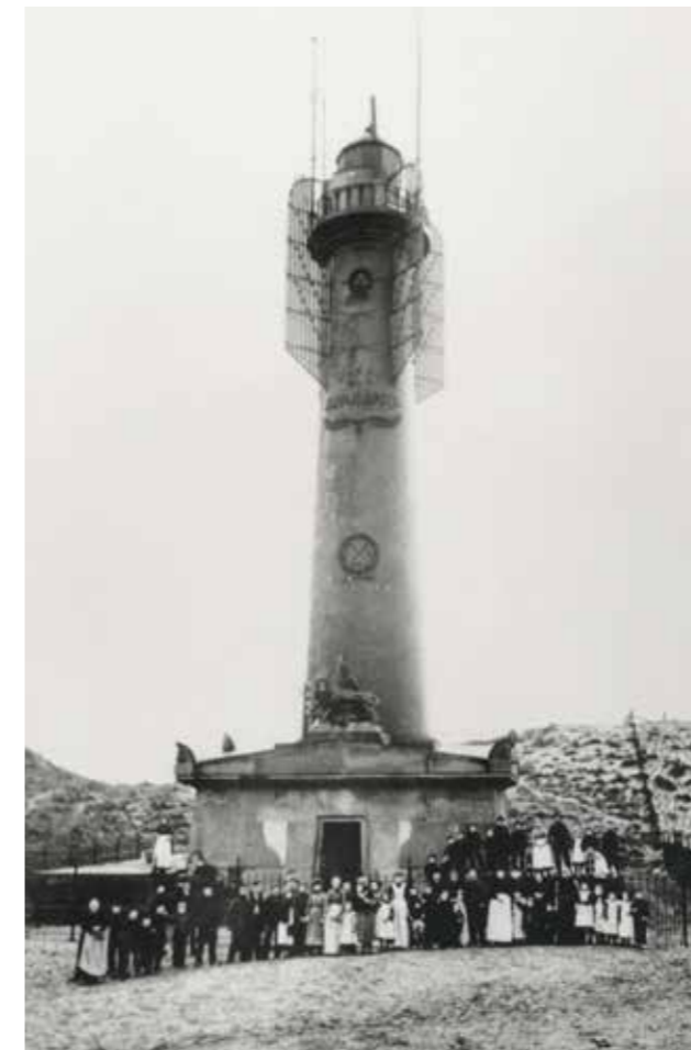
De Van Speyktoren omstreeks 1900, met de in 1873 aangebrachte ijzeren schermen.

In 1876 kwam het Noordzeekanaal gereed en in 1878 werden bij IJmuiden twee gietijzeren vuurtorens gebouwd om de scheepvaart naar het kanaal te geleiden. Deze lichtlijn werd op 19 februari 1879 voor het eerst ontstoken. Dit leverde verwarring op voor de scheepvaart, want net als Egmond had IJmuiden nu twee roodbruine vuurtorens met witte vaste lichten. Om deze verwarring op te heffen kregen de torens van IJmuiden witte banden en werden de optieken van Egmond voorzien van rood glas. Op