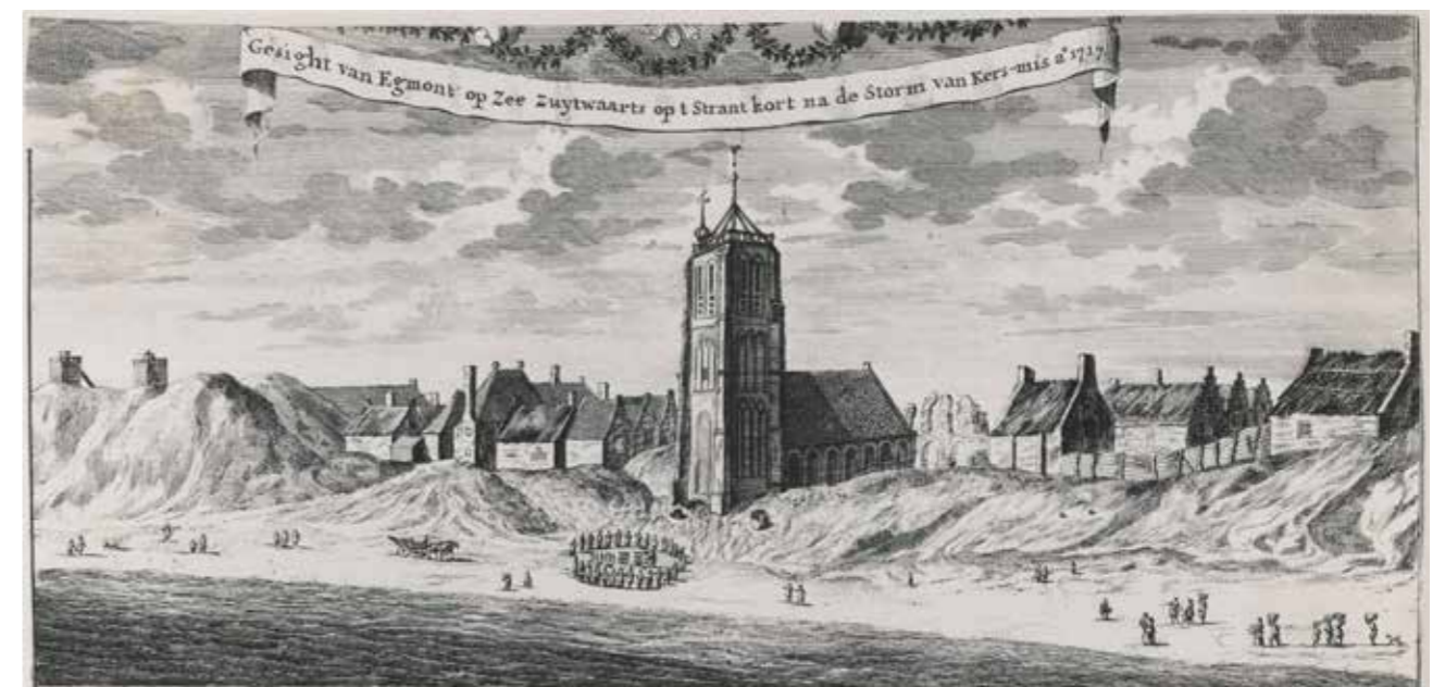
Egmond aan Zee kort na de kerststorm van 1717. De Sint Agneskerk staat gevaarlijk dicht bij de kustlijn. Links twee stenen vuurboeten.

Op 30 december 1823 werd bij koninklijk besluit bepaald dat de kustverlichting in Nederland verbeterd zou moeten worden door op een twaalfstal plaatsen verkenningsschichten met Fresneloptieken te realiseren, waaronder een licht van de eerste grootte te Egmond aan Zee. Door financiële problemen bij het Rijk, onder andere door het conflict met de Zuidelijke Nederlanden (het huidige België), kwam dit plan nauwelijks tot uitvoering. Ondertussen bevonden de kolenvuren van Egmond zich in slechte staat. In 1830 werd een voorstel ingediend om beide vuurbaken te herstellen en te voorzien van olielampen maar ook dit is niet tot