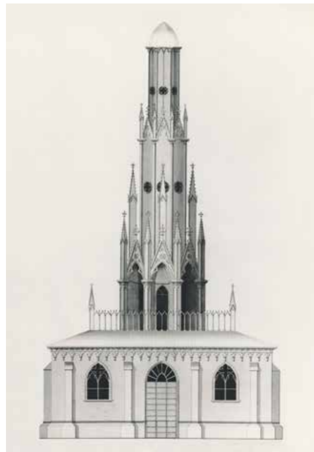
Ontwerp voor het monument van ijzergieterij Nering Bögel uit 1833.

Op 20 juli 1837 kreeg Twent van de koning de opdracht om een plan voor te leggen van een monument waarvan de kosten niet hoger mochten zijn dan het bedrag dat reeds beschikbaar was gekomen, verhoogd met de inmiddels verkregen rente. Twent berichtte op 11 augustus 1837 dat beide torens niet geschikt waren om te verbouwen tot monument en dat dit ook niet wenselijk was omdat de scheepvaart hiervan teveel hinder zou ondervinden. Hij stelde dat het nodig was om een geheel nieuwe toren te bouwen om een waardig monument te realiseren en stelde voor om Zocher een ontwerp te laten maken voor een toren bij de bestaande zuidelijke toren. Het College Zeemanshoop bleef echter bij zijn voorstel om de noordelijke toren op eenvoudige wijze als monument in te richten en de koning ging hiermee akkoord. Twent trok na 6 jaar verzet aan het kortste eind. Op 13 november 1837 verzocht de koning Zocher om zijn schets voor het monument verder uit te werken. Na nog wat gearrewar