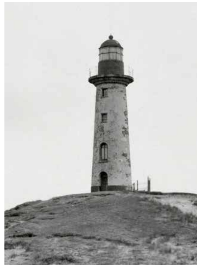
De Zuidertoren in 1915.