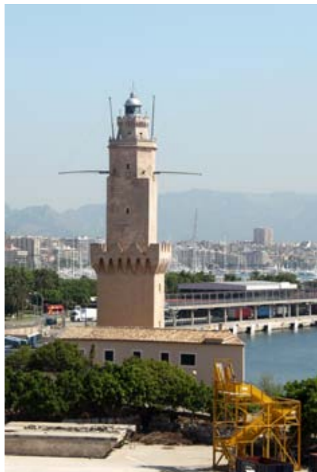
Faro de Porto Pi.

Petten is diverse keren ten onder gegaan en elders weer opgebouwd. De geschiedenis kent een Petten aan de Zijpe en een zuidelijker gelegen Petten in Nolmerban. Daar tussenin lag Petten aan het Hondsbos, dat tijdens de