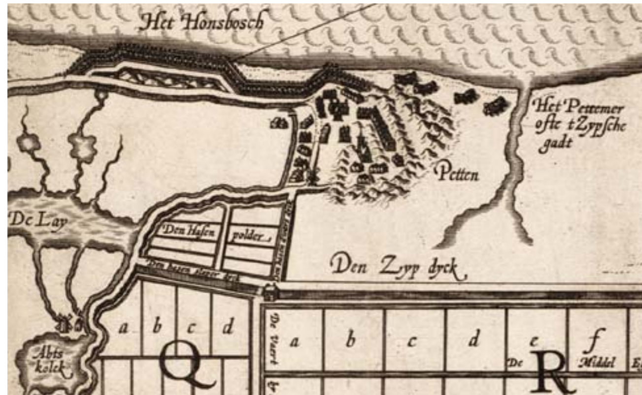
Fragment van de kaart van de bedijking van de Zijpe, van Baptista Doetecomius uit 1600.

Een vergelijkbaar beeld is geschetst op een tekening van Claes Janszoon Visser uit 1608. De vuurboet komt hierop nog wat duidelijker naar voren. Het paalwerk van de