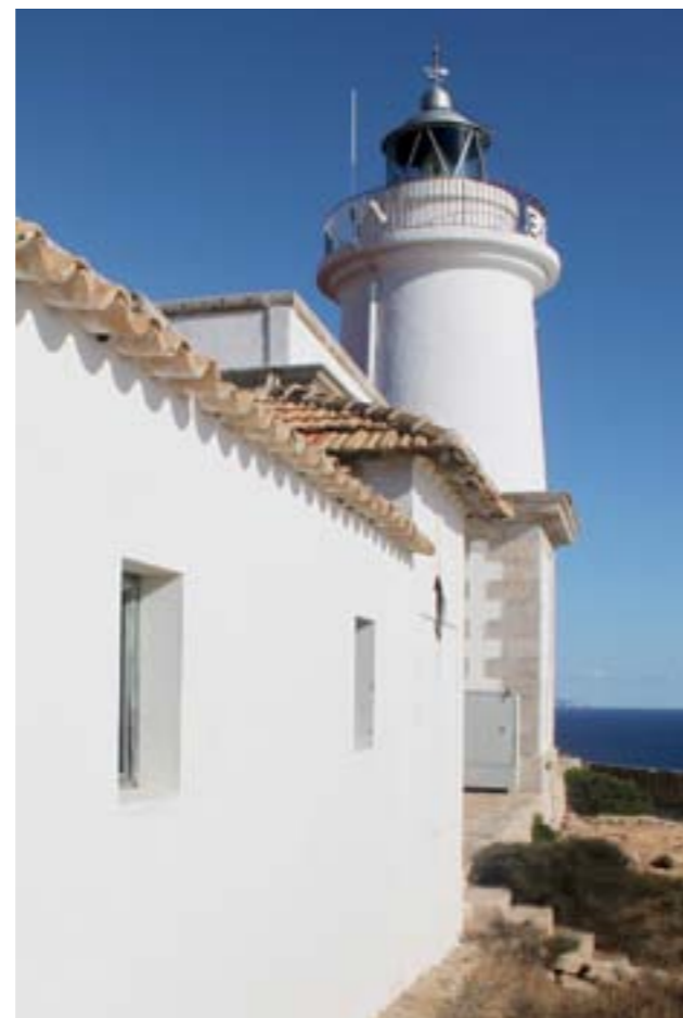
Faro de Cap le Blanc.