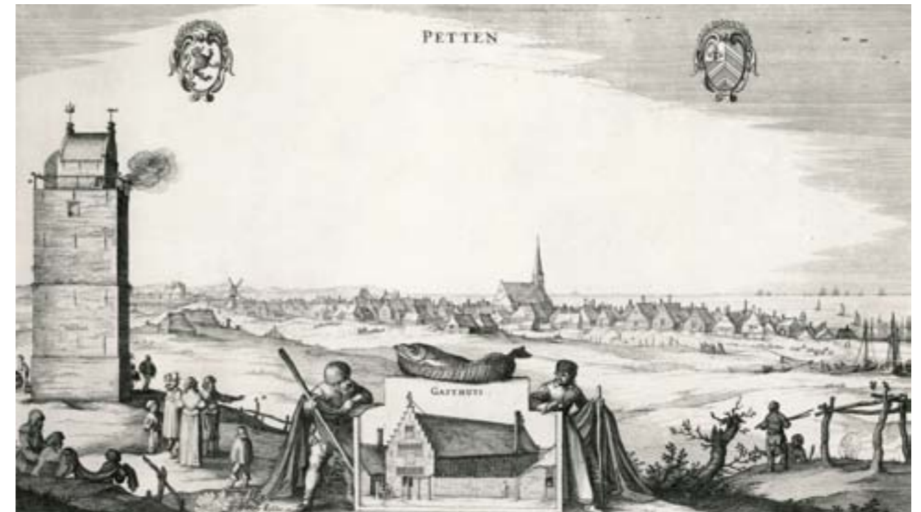
Gravure van Petten door C.J. Visser, 1615.