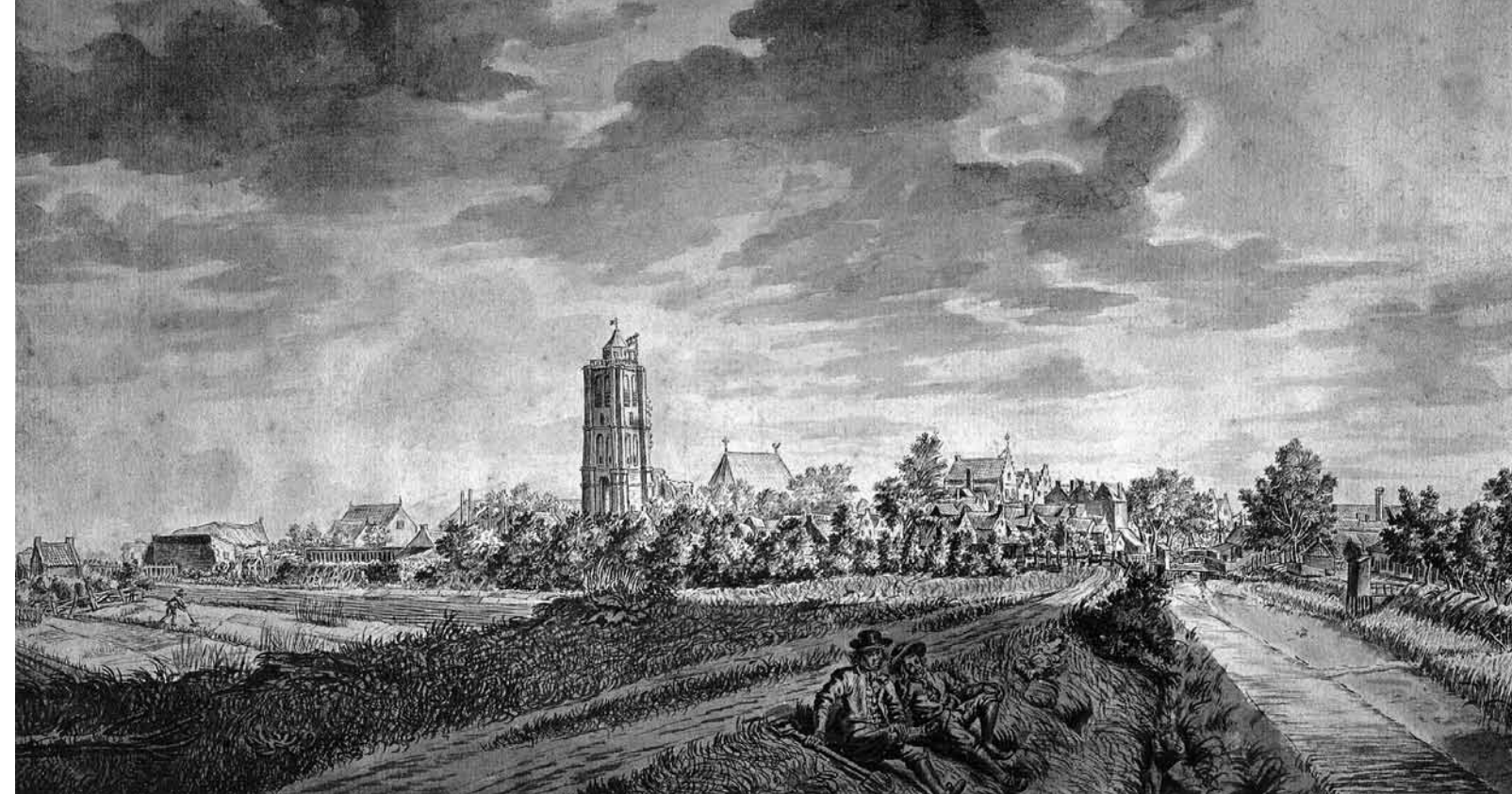
Pentekening van C. Bakker uit de achttiende eeuw. Collectie Torenmuseum Goedereede.

De auteurs van het boekje vermelden het jaar 1616 als het moment waarop de kerktoren vuurtoren werd. Dit