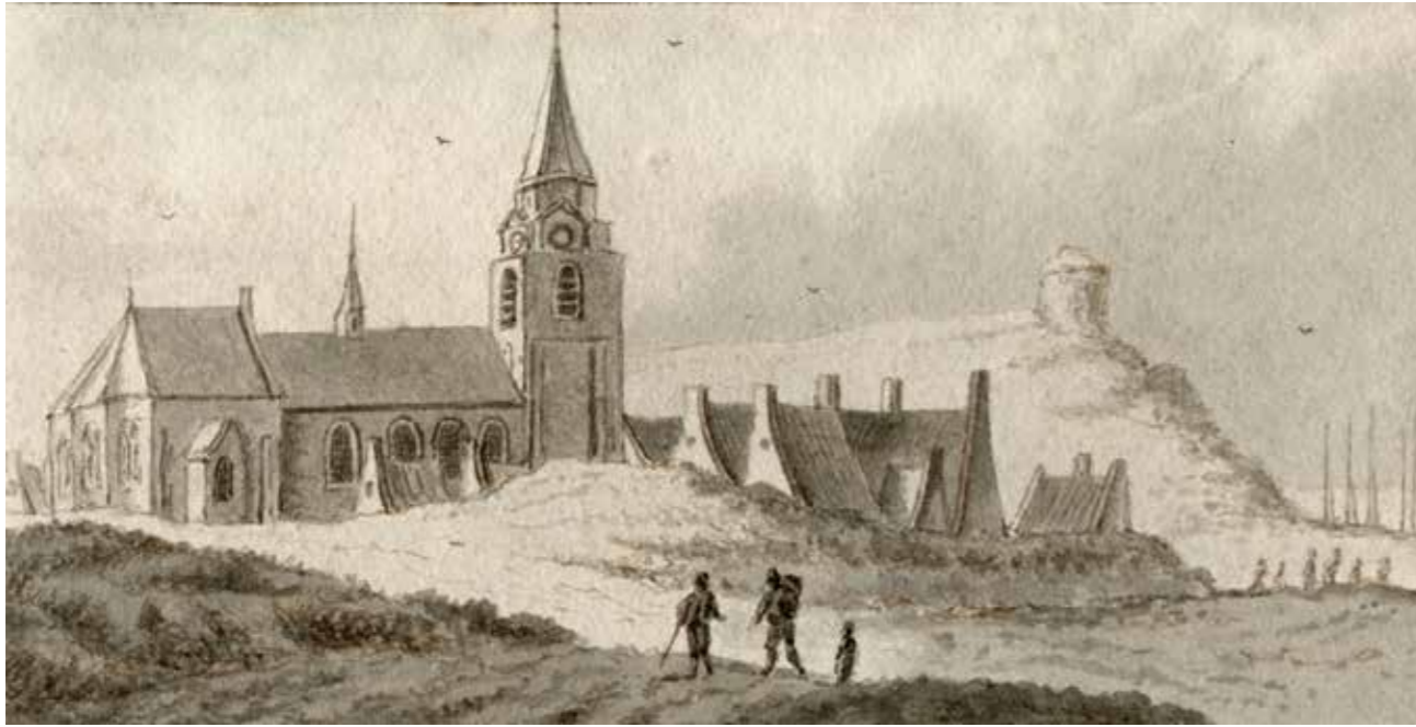
Scheveningen omstreeks 1700, op een tekening van H.E. Beth, naar Abraham Rademaker. Op het duin rechts staat de vuurbaak.

De opkomst van de handel met het Verre Oosten in de zestiende eeuw leidde tot een enorme toename van de scheepvaart langs de Nederlandse kust. De oprichting van de Verenigde Oost-Indische Compagnie in 1602 gaf daar nog eens een extra impuls aan. Er werden steeds hogere eisen gesteld aan de bebakening van vaarwegen. Ook werd de behoefte aan een meer centrale aansturing van het beheer van de vuren langs de kust groter. Niet alleen handelsbelangen maar ook militaire belangen speelden