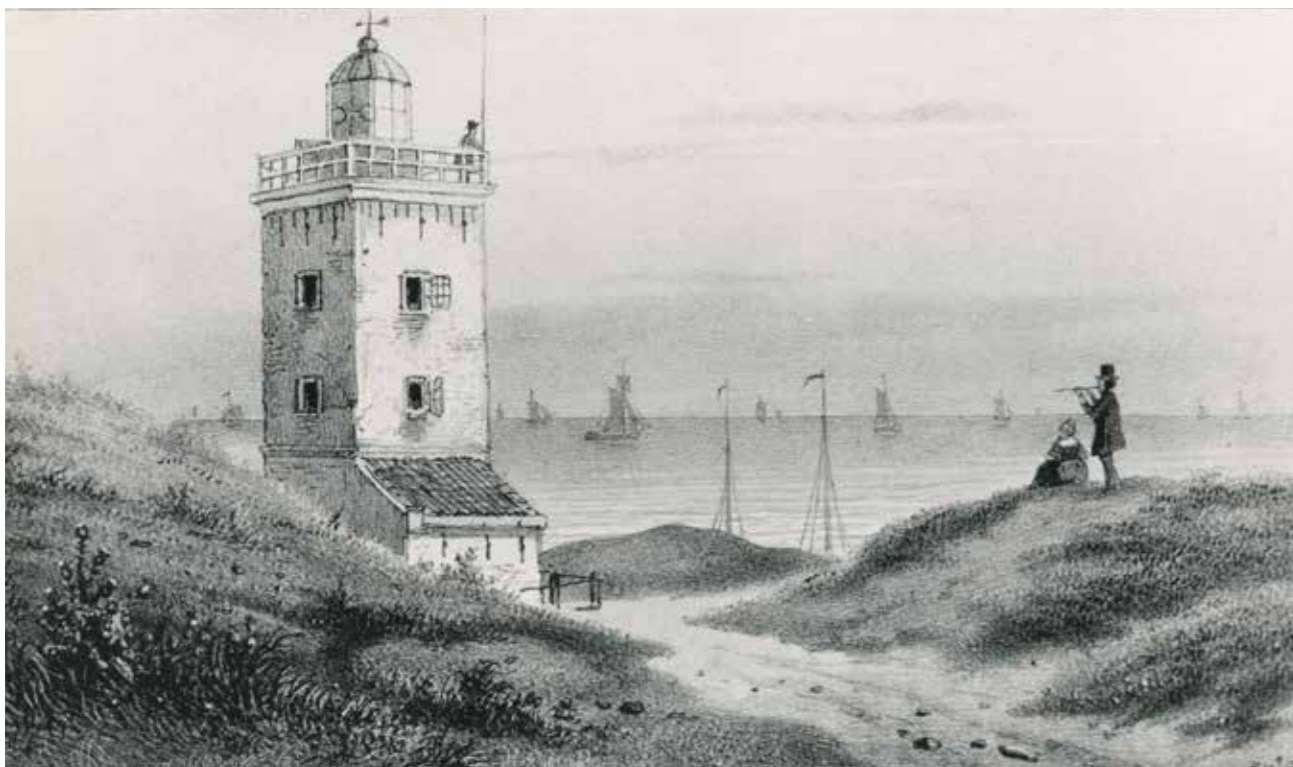
De verhoogde vuurbaak op een litho van H.W. Last uit 1855/1856.

In september 1799 werd op een hoog duin, niet ver van de vuurbaak, een seinpaal of 'semafoor' opgericht. Een semafoor is een constructie waarmee met visuele middelen op afstand signalen doorgegeven kunnen worden. Men spreekt ook wel van een optische telegraaf. Napoleon zag het militaire belang van deze vinding en plaatste overal langs de kust semafoorposten, die met elkaar een optische telegraaflijn vormden. Visuele signalen konden van de ene post naar de andere worden overgebracht en zo in relatief korte tijd over grote afstand worden doorgegeven. Daarmee ontstond een snel waarschuwingssysteem voor