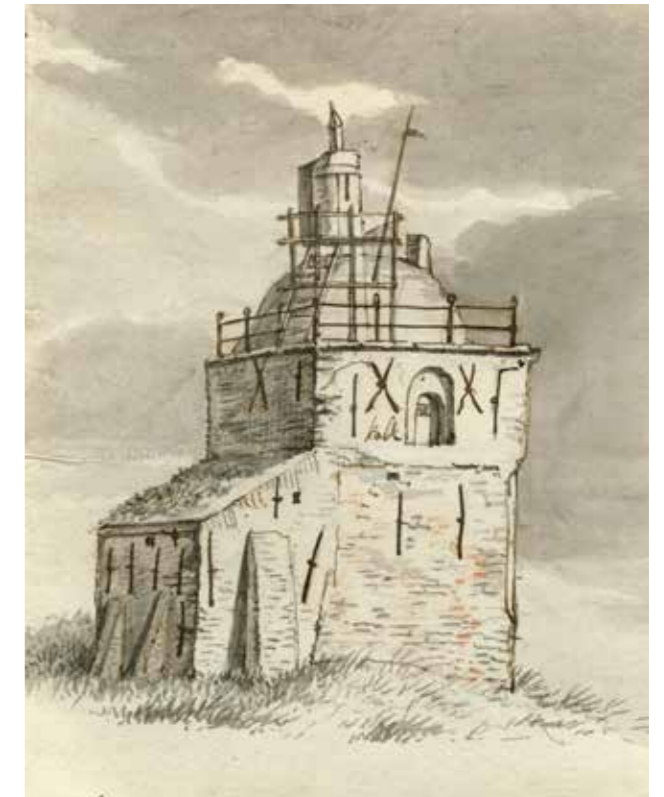
De vuurbaak op een tekening van Nolthenius de Man uit 1815.