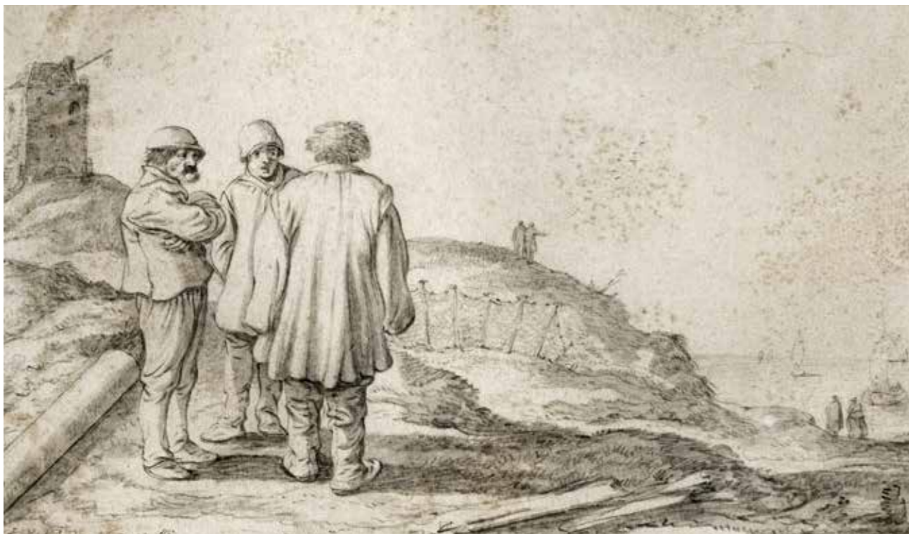
Drie mannen op een duin in Scheveningen. Links de vuurbaak met een vuurkorf aan een staak. Tekening van Esaias van de Velde uit 1625.

Omdat de vuurboet allengs in verval raakte, richtten de 'Burgemeesters en de Regierders van den Hage', mede namens de vissers van Scheveningen in 1589 het verzoek aan het hoogheemraadschap om een nieuwe vuurboet te mogen 'opmetselen' op een hoog duin vlakbij de oude vuurboet. Het hoogheemraadschap gaf daartoe toestemming maar toch duurde het nog tot 1595 voordat die nieuwe vuurboet of 'vuurbake' werd gebouwd. De nieuwe vuurbaak moest worden bekostigd uit de inkomsten van de visserij, dus wellicht duurde het daarom een tijd voordat het benodigde bedrag bij elkaar was gespaard. De oude vuurboet bleef staan en stond er in 1712 nog, zoals blijkt uit een kaart van het Hoogheemraadschap van Delfland uit dat jaar, vervaardigd door Nicolaus en Jacobus Cruquius.