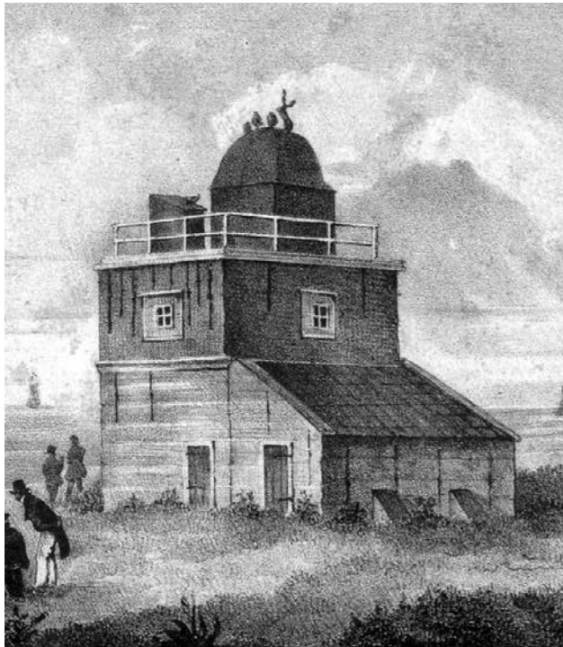
Gedeelte van een litho van de gebroeders Van Lier, uit circa 1840.

te verbeteren. Een aantal vuren langs de kust, waaronder dat van Scheveningen, moest worden omgevormd tot verkenninglichten, die van grote afstand zichtbaar zouden zijn. In 1815 is de stenen koepelvormige stookplaats van de vuurbaak van Scheveningen afgebroken om plaats te maken voor een veel grotere lantaarn dan die van 1807. Het werk werd aangenomen door D. de Ridder uit Dordrecht. In de lantaarn werden drie Argandse olielampen