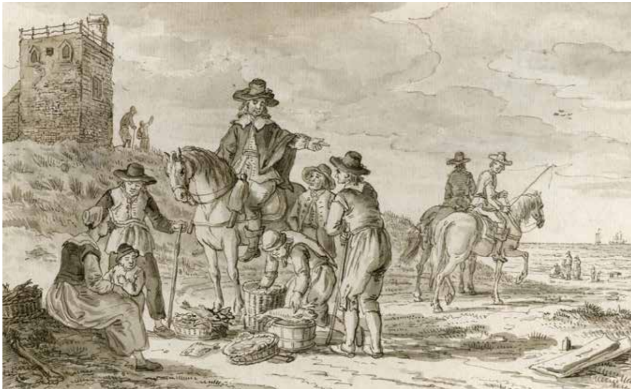
Verkoop van vis op het strand van Scheveningen. Tekening uit 1770 van Paulus Constantijn la Fargue.

daarbij een rol. De oorlogsvloot moest verzekerd zijn van een betrouwbare bebakening. In 1615 besloten de Staten van Holland en West-Friesland daarom een eigen stelsel van vuren te gaan onderhouden. De staten stelden 'colleges van pilotage' in, die zich bezig hielden met het toezicht op 'het vuren' en de beloodsing van schepen. Het vuur van Scheveningen was een van de eerste waarvan de staten het beheer overnamen. De staten legden de verantwoordelijkheid voor het beheer van de vuurbaak