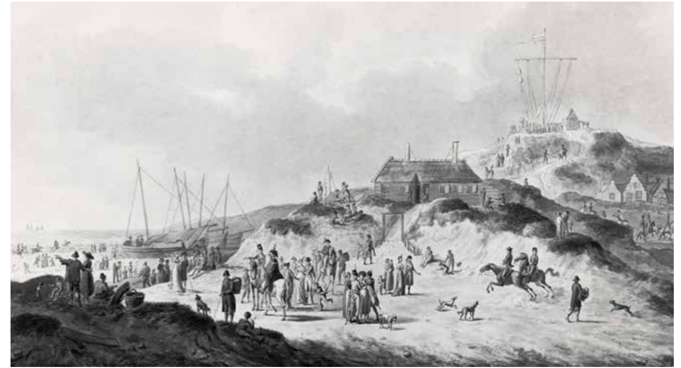
Scheveningen in 1800. Tekening van Dirk Langendijk. Op het hoge duin op de achtergrond staat de Bataafse Semafoor.

naderende aanvallen van de Engelse oorlogsvloot. In de tijd van de Bataafse Republiek werd ook in Nederland zo'n optische telegraaflijn opgericht tussen Texel en Vlissingen, bestaande uit 42 semaforen, waaronder die van Scheveningen. De Bataafse semaforen bestonden uit een mast met een ra waaraan bollen, vlaggen en lantaarns konden worden opgehesen. Na de Franse Tijd zijn veel semaforen afgebroken. De straatnaam Seinpostduin herinnert ons nog aan de semafoor van Scheveningen.