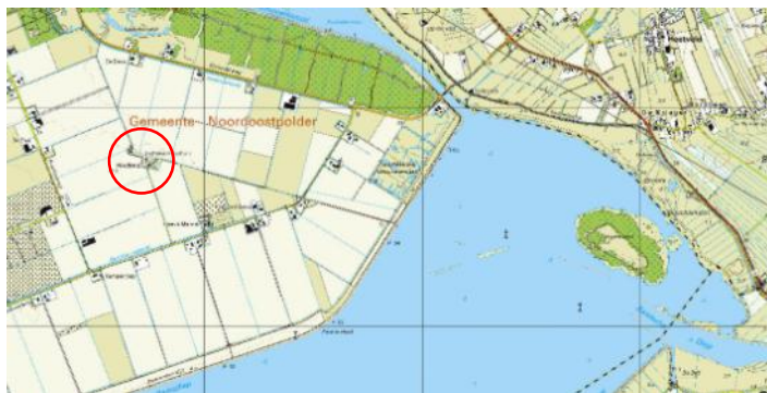
Een deel van de Noordoostpolder en de monding van het Zwolsche Diep in 2017. Oud-Kraggenburg bevindt zich in de rode cirkel.

door Peter Kouwenhoven / Nederlandse Vuurtoren Vereniging (www.vuurtorens.org), februari 2019