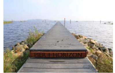
Het landschapskunstwerk Pier + Horizon.