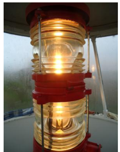
De dubbellenslantaarn die in 2016 in het lichthuis van Oud-Kraggenburg werd geplaatst.