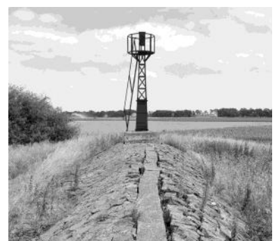
Een serie foto's van Oud-Kraggenburg in juni 1999.