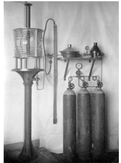
De optiek van Kraggenburg die voor 1940 dienst deed. Rechts de gascilinders voor de voeding van het gloeilicht.

In 2016 werd de lijn in het kavelpatroon, die de ligging van de leidammen markeert,