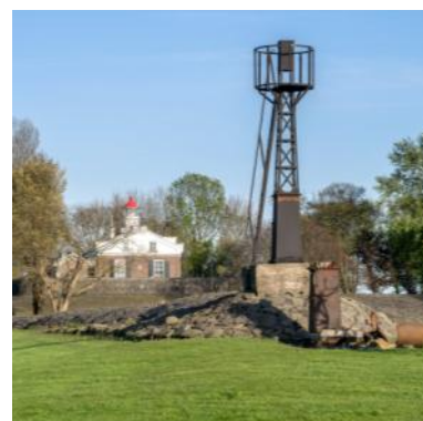
De replica van het geleidelicht uit 1919 op de zuidelijke leidam. De vervallen originele lichtopstand ligt ernaast.