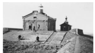
Kraggenburg, in de jaren '40. Op het schuurtje naast de woning is de lantaarn nog aanwezig.