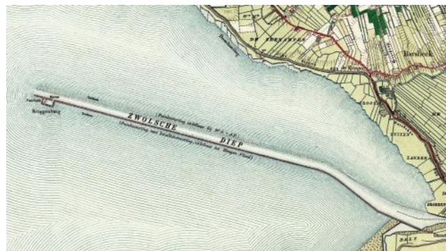
Het Zwolsche Diep in 1900. Aan het eind van de zuidelijk leidam bevinden zich de vluchthaven en de terp met de lichtwachterswoning.