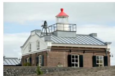
Oud-Kraggenburg in 2014.