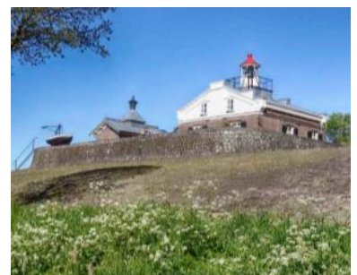
Oud-Kraggenburg in 2018. Het schuurtje heeft weer een lantaarn.