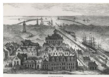
IJmuiden in 1880.

Al snel bleek dat de verlichting aan de monding van het kanaal niet voldoende was. Daarom ontwierp Quirinus Harder, bouwkundige bij het Loodswezen, in 1877 twee hoge gietijzeren vuurtorens die een nieuwe lichtenlijn moesten vormen voor het invaren van het kanaal. Het ontwerp omvatte twee vrijwel identiek torens, met het verschil dat