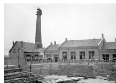
De vuurtoren, de nieuwe machinekamer en opzichterswoning in 1917.