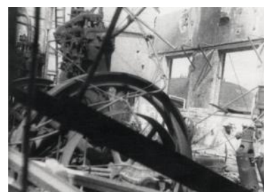
De in 1943 gebombardeerde machinekamer.