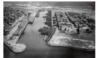
De Vissershaven in de jaren '20.