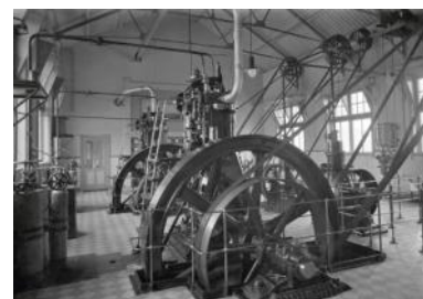
Het interieur van de nieuwe machinekamer in 1917.