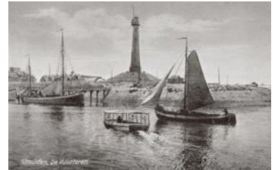
Het hoge licht omstreeks 1930. Door het afgraven van het duin is de vuurtoren op een terpachtige verhoging komen te staan.