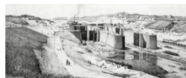
Sluis in aanbouw in 1875.