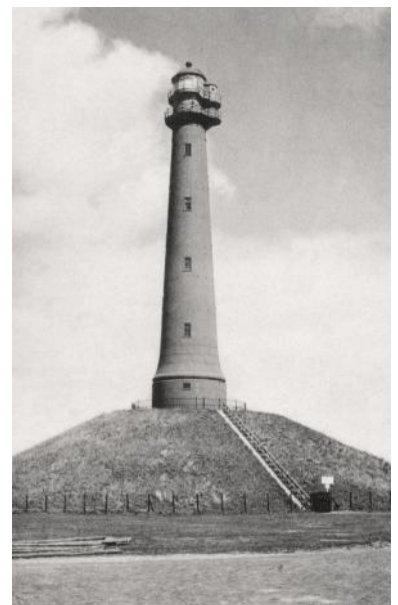
Het hoge licht in 1953. De in 1908 aangebracht uitbouw van de lantaarn en de lantaarnkuip is hierop goed te zien.