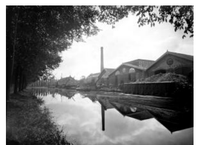
De fabriek van Schretlen in Leiden, gezien vanaf de Singel, in 1860.