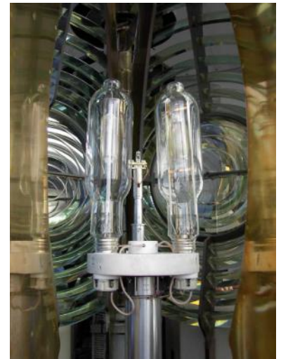
Lampenwisselaar met kwikjodidelampen.