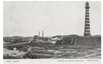
Het hoge licht in 1908, nog in de natuurlijke duinomgeving.

De eerste gietijzeren vuurtorens werden opgebouwd uit platte segmenten, waardoor de torens hoekig van vorm werden. Voor platte segmenten was het makkelijker om houten gietmallen te maken dan voor gebogen segmenten. Het duurde dus even voordat men de giettechniek voor ronde vuurtorens in de vingers had. De eerste ronde gietijzeren vuurtoren, het lage licht van Westkapelle, is in de periode 1875-1876 gebouwd. De