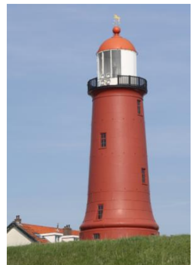
Het lage licht in 2014.