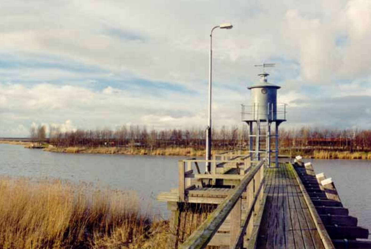
Het vuurtorentje van Zoutkamp in 2001.